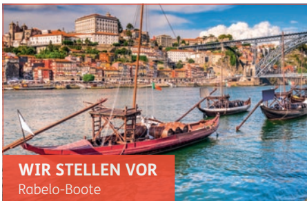
WIR STELLEN VOR Rabelo-Boote

Die traditionellen Rabelo-Boote wurden in der Vergangenheit dazu genutzt, die Portweinfässer der Region rund um den Douro zu den Weinkellereien in Porto zu befördern. Heute nehmen sie einen eher touristischen Charakter an. Am zweiten Tag Ihrer Reise unternehmen Sie eine „Rabelo-Bootsfahrt“ auf dem Douro und genießen das imposante Panorama Portos vom Wasser aus.